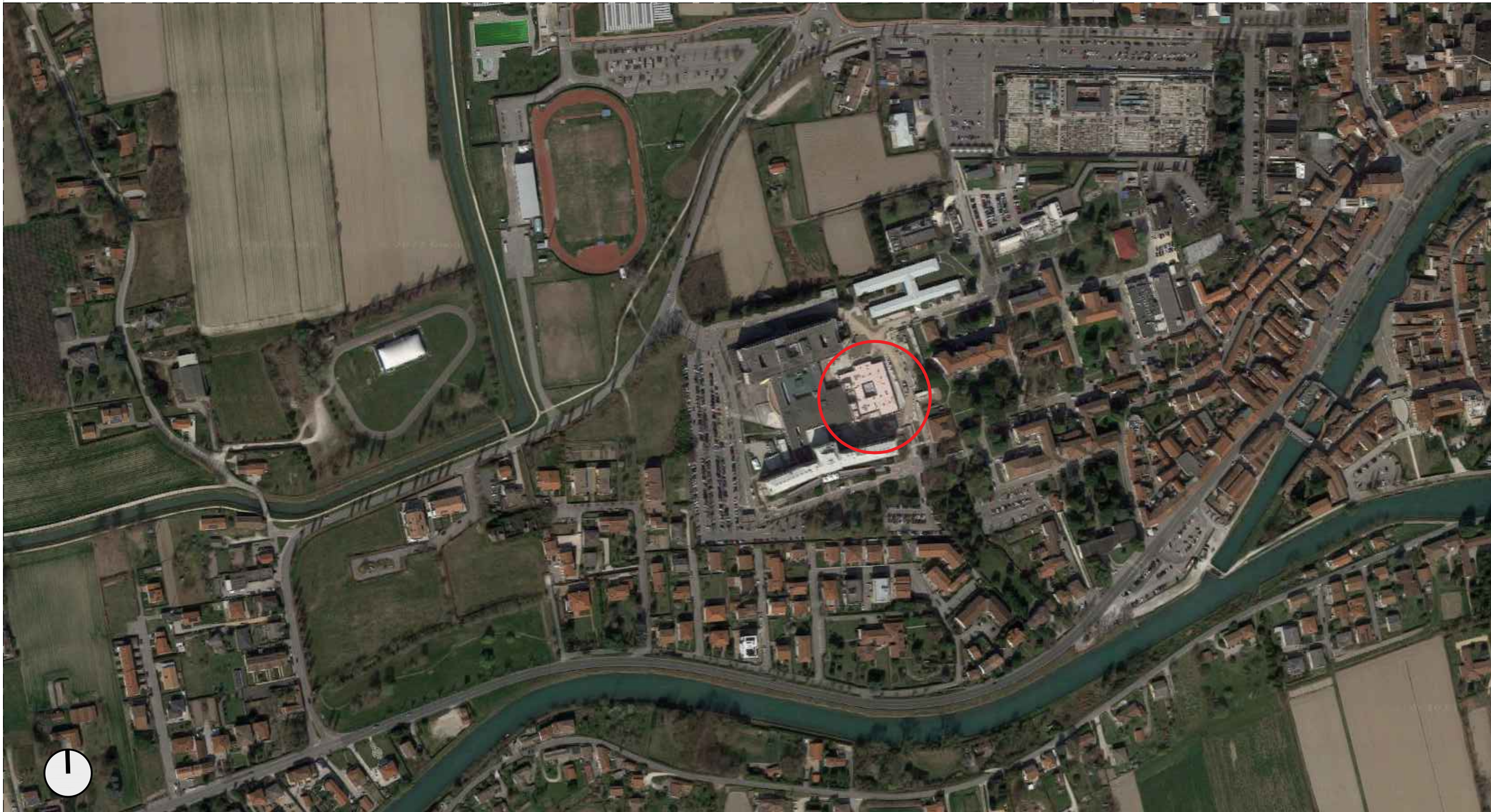
VISTA AEREA DELL'OSPEDALE DI DOLO (scala a vista)