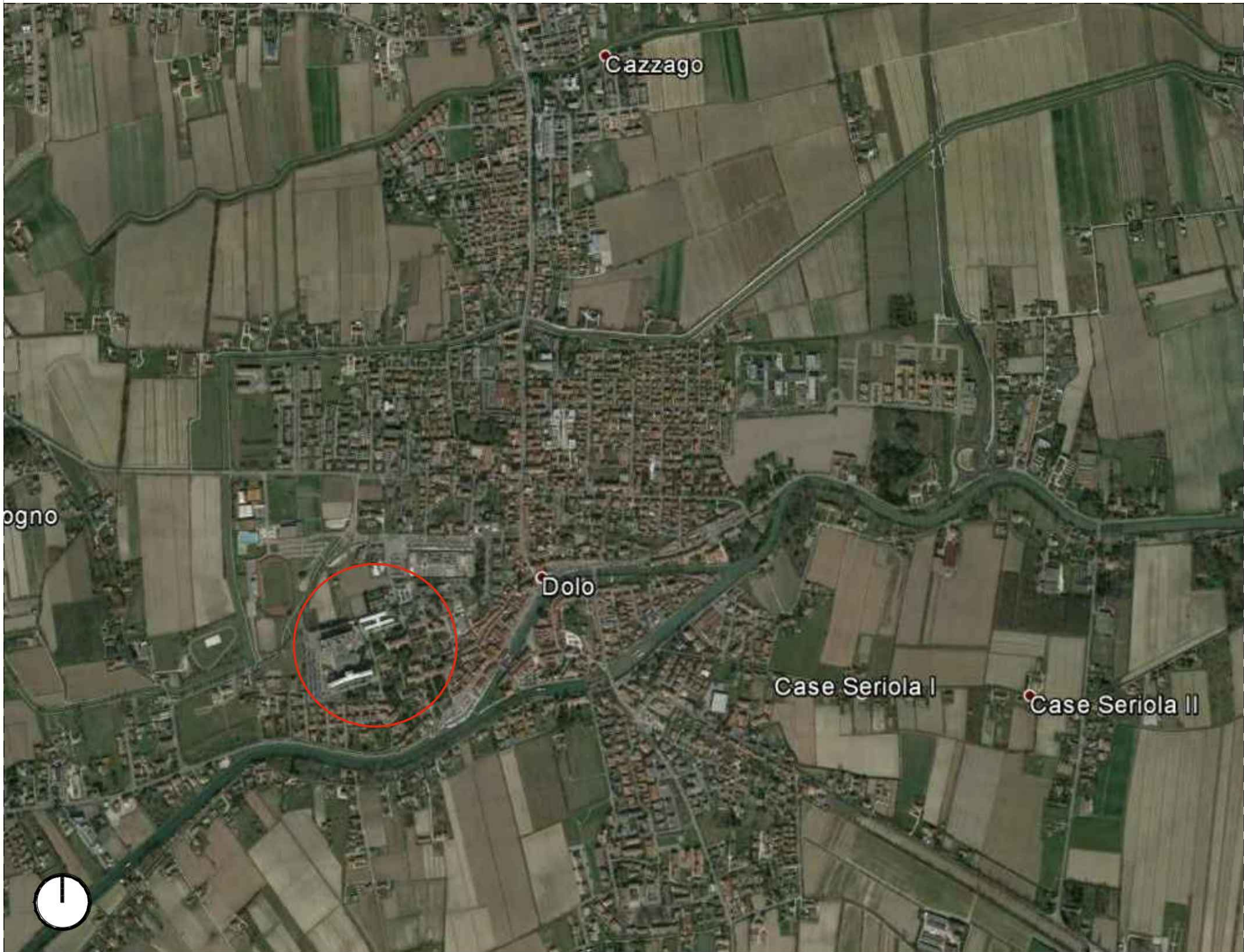
OSPEDALE DI DOLO - STRALCIO AEROFOTOGRAMMETRICO (scala a vista)